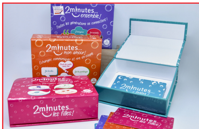
2 minutes papa!®, 2 minutes ensemble!®, 2 minutes mon amour!® et 2 minutes les filles!®, 4 jeux pour multiplier les moments de complicité.

Les jeux 2 minutes!® , ce sont 52 cartes, 52 questions où chacun répond à tour de rôle en 2 minutes. Basées sur les principes de la psychologie positive , les questions sont classées en 4 catégories, différentes selon les jeux : « Aujourd'hui... », « Je me rappelle... », « Et si... », « Tout de suite... ».